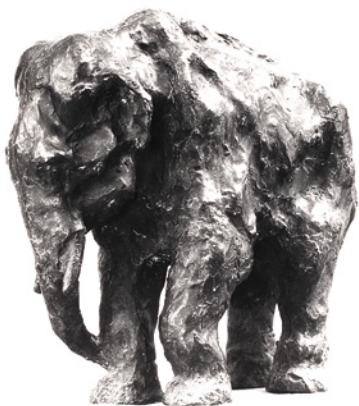
«Слон» Бронза, 1901

катятся из ее глаз. Уважение и сострадание запечатлено в бронзовом «Слоне» и в тонированной фигурке заботливой и трогательной «Обезьянки».