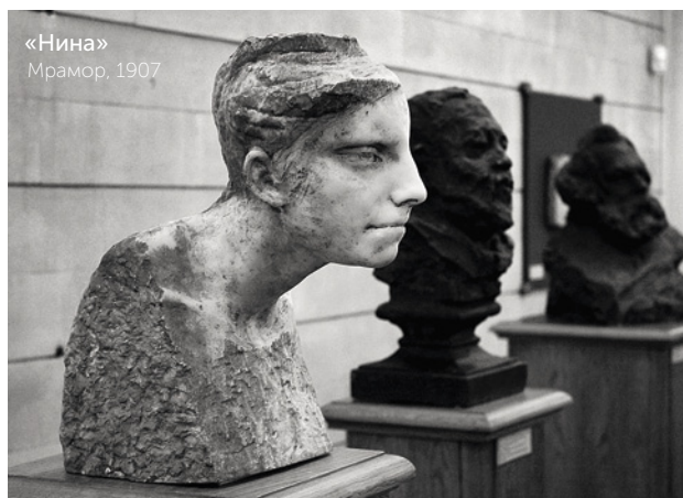
«Нина» Мрамор, 1907

В мастерской зримо и ясно проступает особенность голубкинского дара — удивительное сострадание к детям и братьям нашим меньшим. Пожалуй, в русской скульптуре нет более трагического проникновения в душу животного, чем в ее рельефе «Лошади». В нем Голубкиной удалось передать чувство чисто человеческого страдания животных, которых вели на убой. На морде правой лошади видны тяжелые слезы, которые