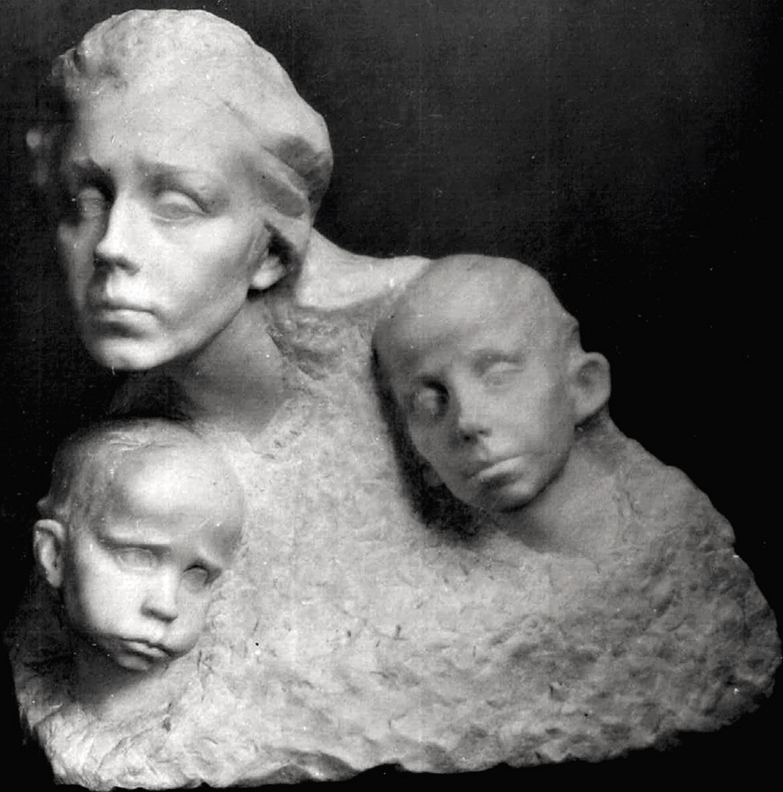
• 483 „Пленники“ 1909 г. •