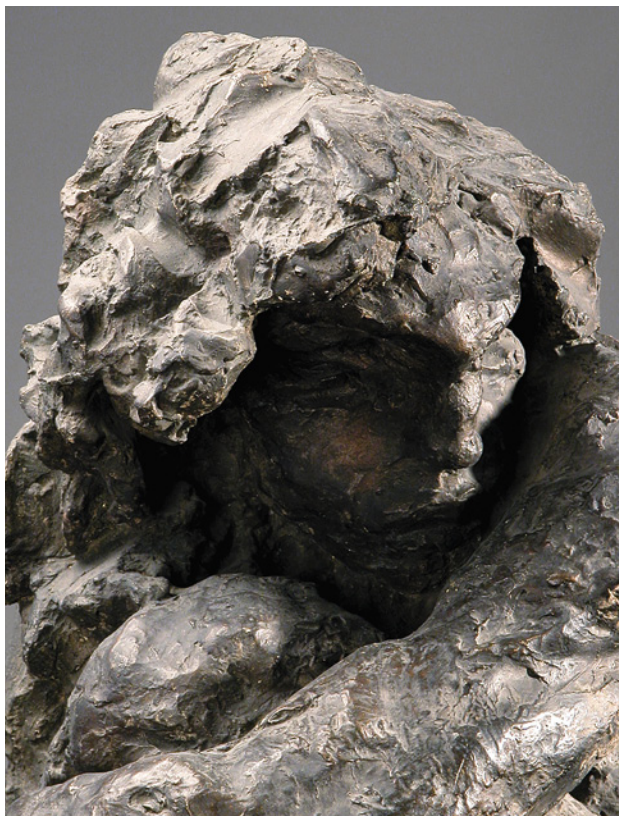
Женская фигура к камину «Огонь»