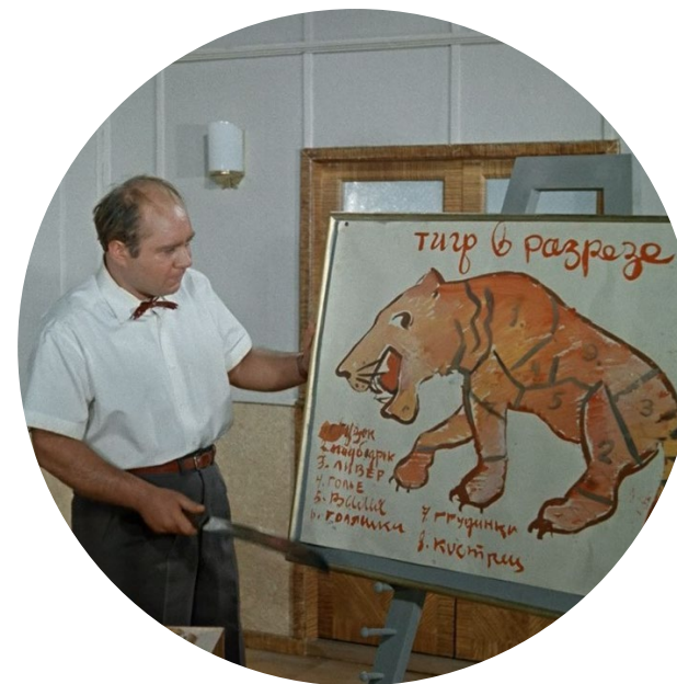
Кадр из к/ф «Полосатый рейс», 1961 г.